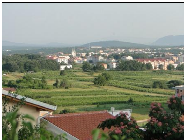
Mễ Du nhìn từ Đồi Hiện Ra !