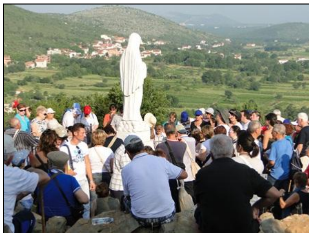
Khách hành hương tề tựu chung quanh Thánh Tượng Đức Mẹ ngày 24-06.

Tôi thật có phúc khi thấy rất nhiều người tề tựu chung quanh Thánh Tượng của Mẹ. Mới đầu có một chút hỗn loạn, nhưng lại thấy hết sức cảm động. Rất nhiều người bày tỏ các điều cần thiết của mình cho Đức Mẹ, bày tỏ lòng sùng kính đối với Đức Mẹ. Thật tuyệt vời !