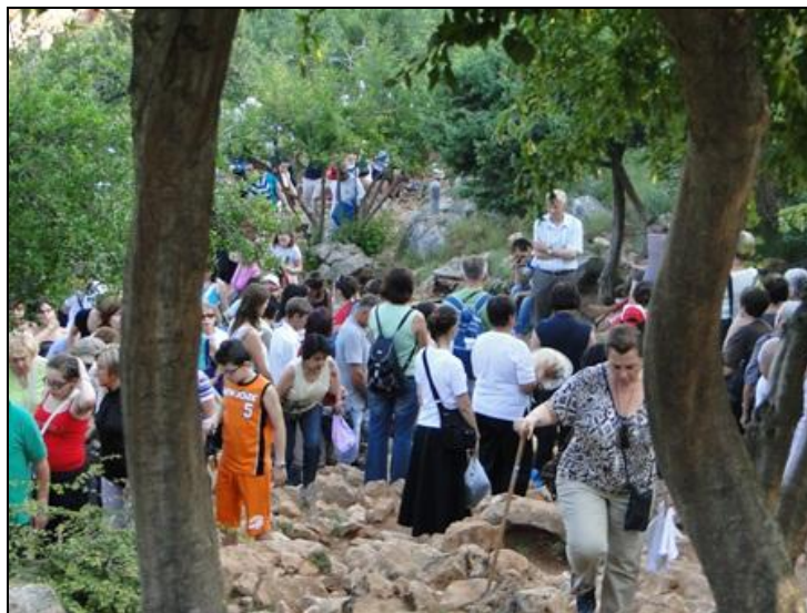
Khách hành hương lên Đồi Hiện Ra ngày 24-06

Tôi thật có phúc khi thấy rất nhiều người tề tựu chung quanh Thánh Tượng của Mẹ. Mới đầu có một chút hỗn loạn, nhưng lại thấy hết sức cảm động. Rất nhiều người bày tỏ các điều cần thiết của mình cho Đức Mẹ, bày tỏ lòng sùng kính đối với Đức Mẹ. Thật tuyệt vời !