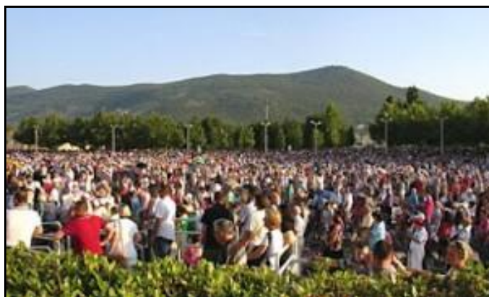
Khách tham dự Lễ Kỷ Niệm và Núi Thánh Giá ở phía sau.

“Nhiều người đi theo đoàn có tổ chức đến Mẹ Du bằng xe đò, xe hơi, và bằng xe đạp. Một số rất đông người đã đi bộ đến từ nhiều nơi ở Herzegovina.”