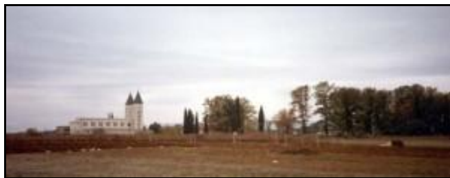
Nhà thờ Thánh Gia-cô-bê trơ trọi trong toàn cảnh ở Mễ Du năm 1981, rất lâu trước khi phát triển thành một thị trấn.

- Theo chúng tôi biết là các phụ huynh của Thánh Nữ Bernadette ở Lộ Đức và các phụ huynh của các thị nhân Fatima, họ đều đánh đập con cái và gọi con cái là đồ dối trá. Nhưng ngược lại, phụ huynh của chị lại che chở cho chị bất chấp các sự hăm dọa của chính quyền cộng sản ?