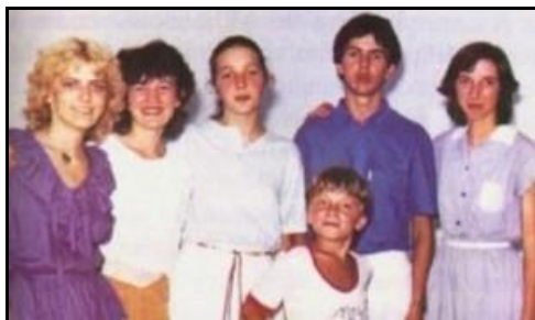
Tất cả 6 thị nhân Mễ Du vào năm 1982

Sau đó Mẹ cho biết rằng Mẹ đến dưới tước hiệu Nữ Vương Hòa Bình, và nói với chúng con rằng hòa bình thật sự chỉ từ Thiên Chúa mà đến, nhờ cầu nguyện. Mẹ mời gọi chúng con cầu nguyện cho hòa bình. Hòa bình trong tâm hồn chúng con, trong xứ sở chúng con và trong toàn thể thế giới.”