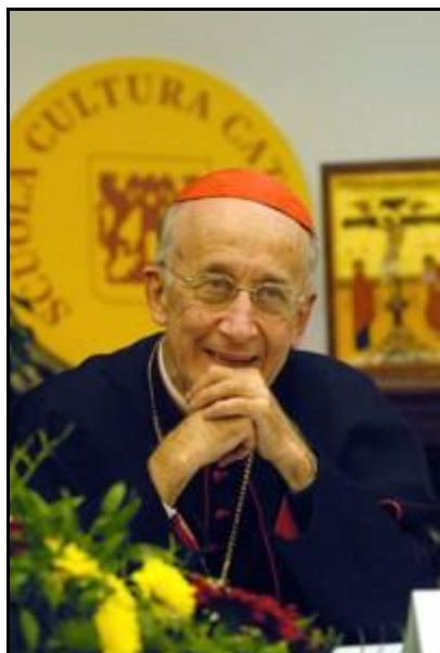
Đức Hồng Y Camillo Ruini, Chủ Tịch Ủy Ban

Tờ báo Vecernji List thường thuật rằng : “Không một ai có thể nói chắc chắn quan điểm của Ủy Ban quốc tế điều tra về hiện tượng Mễ Du sẽ như thế nào, ngoại trừ những lời đồn thổi ngoài hành lang Tòa Thánh Vatican vẫn còn vang lên rằng thái độ của Ủy Ban sẽ là một hình thức thỏa hiệp.”