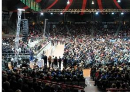
Một góc đám đông trong sân vận động thể thao ở Varese

Theo mạng truyền thông Varese News, chị đã phát biểu : “Đức Trinh Nữ Maria Hồng Phúc không ban ra một Sứ Điệp cụ thể nào, nhưng Mẹ thúc giục tất cả chúng ta hãy tìm Thiên Chúa bằng việc làm theo các Sứ Điệp của Mẹ. Sự cứu rỗi duy nhất cho tương lai của nhân loại đang ngày càng có nhiều nguy cơ.”