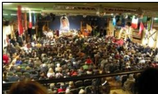
Một góc đám đông 900 người ở Canazei

Theo tờ báo địa phương Trentino Corriere Alpi , chị Marija phát biểu : “Chúng ta phải sợ điều gì ? Các lời tiên tri, các cơn bão hay là tận thế sẽ đến vào ngày 21-12 này như người ta đang bàn tán ? Ngày tận thế có thể đến mỗi ngày, nhưng dường như đời sống chúng ta lại tùy thuộc vào lá số tử vi hay những điều bói toán trong ngày, nhưng chúng ta phải học hỏi những người trong quá khứ đã tin tưởng Thiên Chúa.”